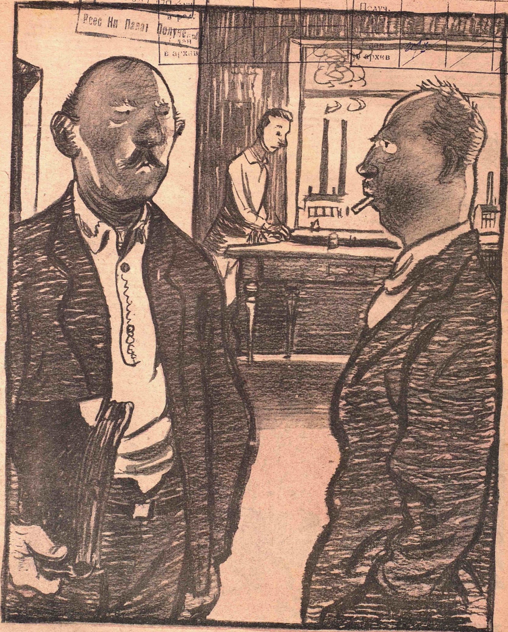
— Объявили кампанию за режим экономии, а не сообщили — декадник это или месячник?