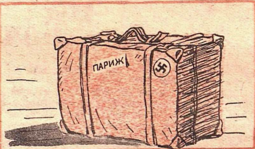
Рис. Г. Валька