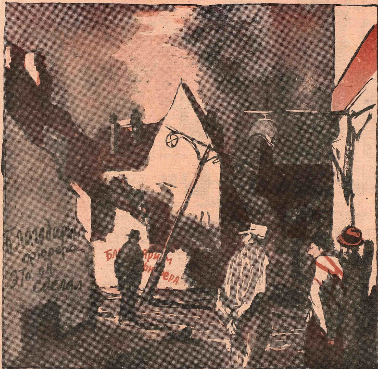
Рис. В. Горяева

— Еще несколько налетов — и в городе не останется ни одного неблагодарного жителя.