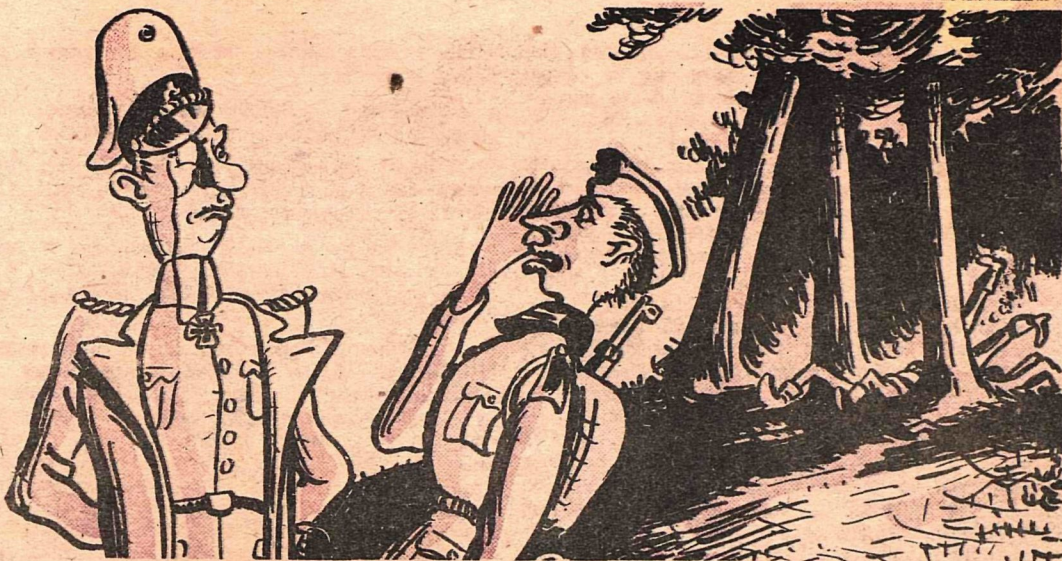
Рис. Б. Фридкина

— Вчера мы столкнулись с отрядом партизан, господин обер-лейтенант! Нас было пятьсот, а их пятьдесят. Однако бой окончился вничью: их осталось пятьдесят и нас пятьдесят.