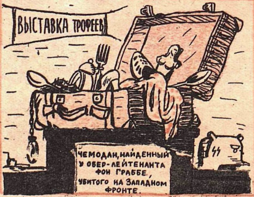
Жизненный путь одного арийского чемодана.